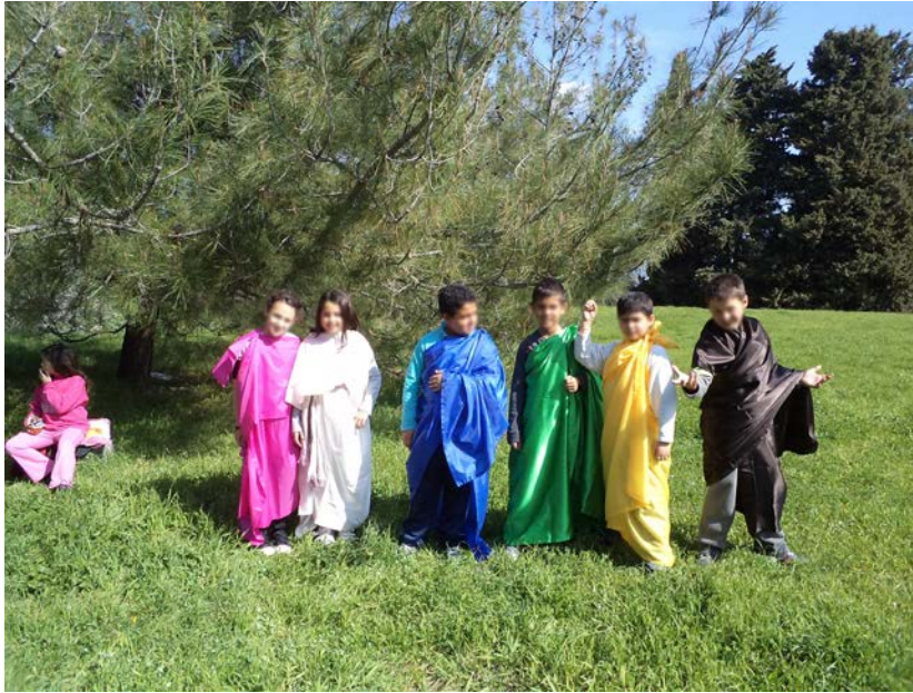
Εικόνα 2. Οι μαθητές ντυμένοι με χιτώνες κατά τη διάρκεια θεατρικής δραστηριότητας στον αρχαιολογικό χώρο.

Τέλος, θέλαμε να φέρουμε εις πέρας ένα θεατρικό δρώμενο της εποχής όπου το Ασκληπιείο έπαιζε σημαντικό ρόλο στην ίαση των ασθενειών. Γι' αυτό διανεμήθηκαν οι ρόλοι και ξεκίνησαν οι πρόβες! Αποκορύφωση της δράσης αυτής θα ήταν η παρουσίαση του στον ίδιο τον ιερό χώρο του Ασκληπιείου της Κω, σε συνδυασμό με την ξενάγηση που θα έκαναν τα παιδιά στους γονείς που θα έρχονταν μαζί. Τελικά, όμως δε μας επέτρεψαν να το παρουσιάσουμε εκεί, διότι μετά από επικοινωνία με τους υπεύθυνους, ενημερωθήκαμε ότι για να γίνει αυτό θα έπρεπε να έχουμε πάρει άδεια, δύο μήνες πριν, από το Υπουργείο Πολιτισμού. Αυτό ήταν κάτι το οποίο δε γνωρίζαμε και φυσικά όταν το μάθαμε, δεν είχαμε πλέον το χρονικό περιθώριο, οπότε η παρουσίαση τελικά έγινε στο χώρο του σχολείου μας στις 13-06-2012, την τελευταία μέρα των μαθημάτων του σχολικού έτους.