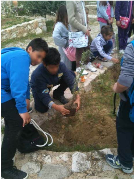
Εικόνα 3. Δεντροφύτευση στον Κήπο του Ιπποκράτη.