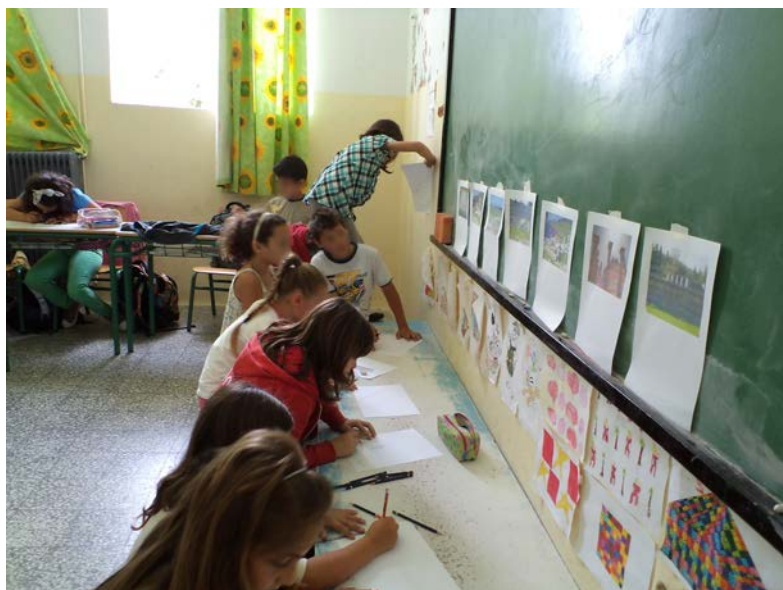
Εικόνα 4. Ετοιμάζοντας τον οδηγό του Ασκληπιείου.